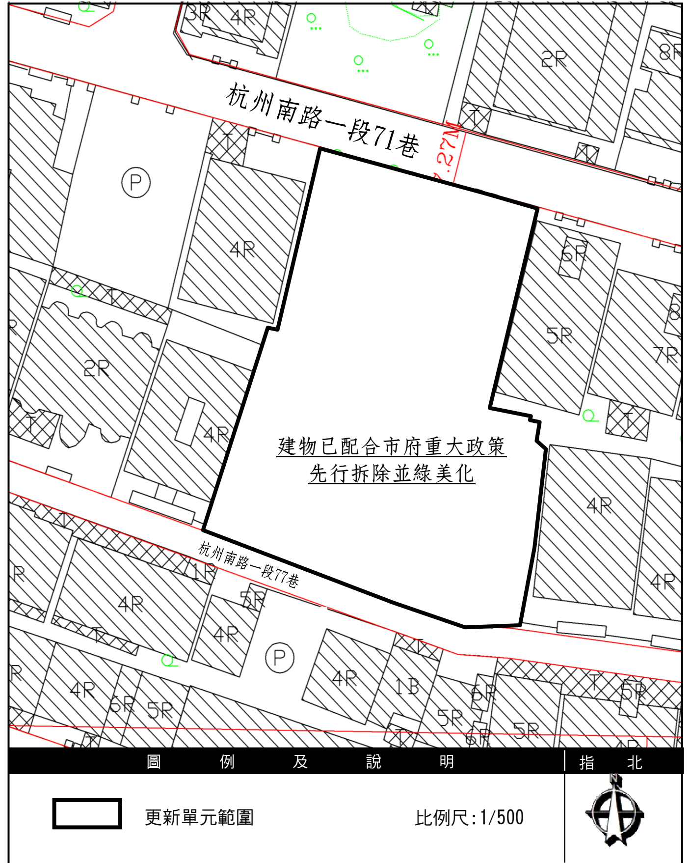
圖 2-3 更新單元地形套繪圖