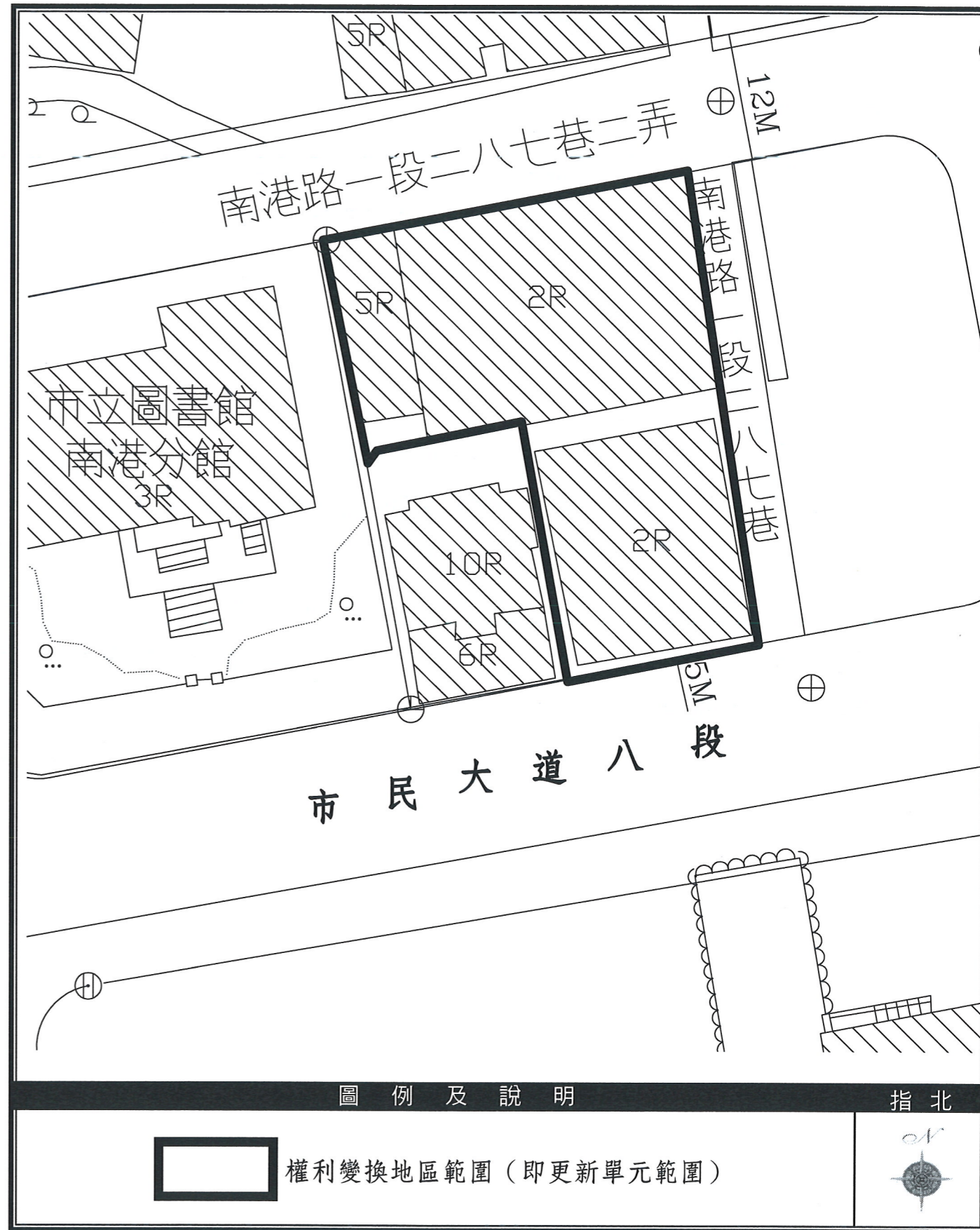
圖 2-2 權利變換地區地籍套繪圖(比例尺:1/500)